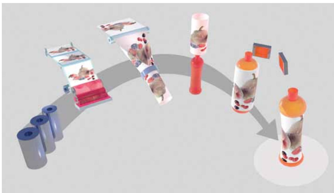
Proceso de etiquetado con etiquetas retráctiles

Cuando compra películas kp, usted sabe que funcionarán en sus máquinas. Ofrecemos una gama completa de espesores con márgenes de tolerancia tan pequeños que le permiten escribir