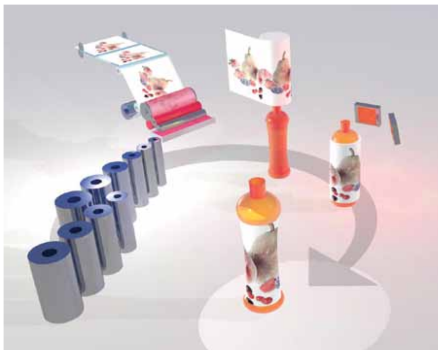
Proceso de etiquetado con etiquetas retráctiles en rollo

especificaciones mas precisas para reducir costes. Ninguna de las películas contiene ftalatos, el origen de sus materias primas es completamente comprobable y sus materiales se mantienen limpios. Las plantas de kp cuentan con las certificaciones ISO 9001 y/o 14001 y la fabricación cumple con las normas de higiene habituales. Ofrecemos formulaciones de Pentalabel® que cumplen con las normas sobre alimentos de la FDA, HPB y la Unión Europea. Las películas Pentalabel® cumplen o superan las normas legales internacionales.